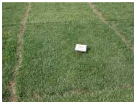
草坪型高羊茅新品种猎狗 6 号