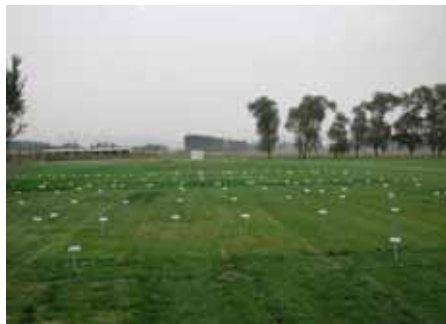
2006 年 10 月北京试验地