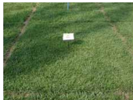
草坪型高羊茅新品种太阳神