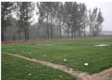
2005 年 5 月北京试验地