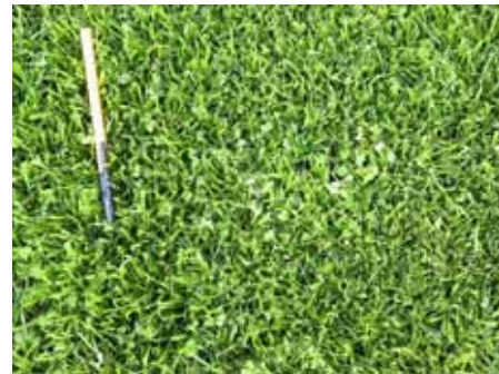
迷你白三叶混播草坪