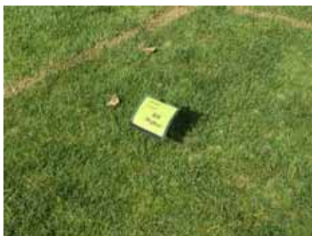
草地早熟禾新品种翡翠